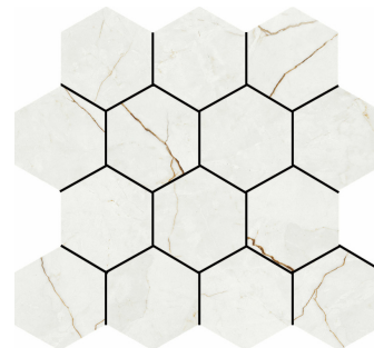
HEXA QUANTUM PULIDO TR-45