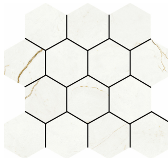
HEXA QUANTUM NATURAL TR-42