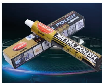
Crema de pulir