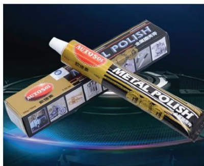
Crema de pulir