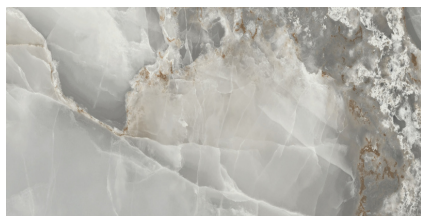
AGATE GREY PULIDO BT6012GRP